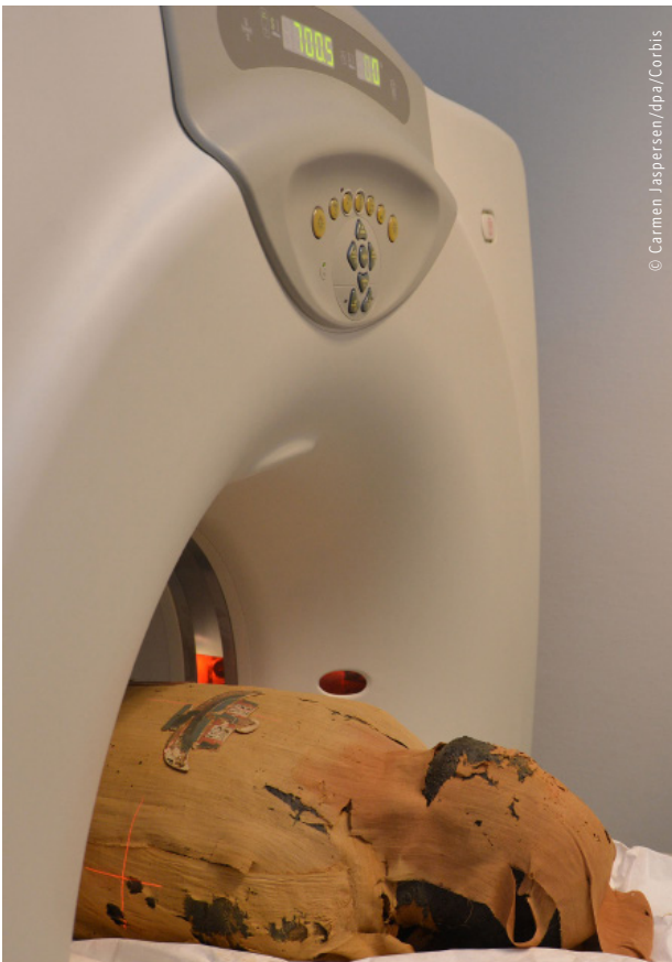
Mummia egizia alla TAC

La tomografia o Tac sfrutta i raggi x per produrre immagini di sezioni degli oggetti studiati; si ottengono in questo modo immagini tridimensionali, come per esempio quelle delle mummie egizie. Nella riflettometria infrarossa si irradia il dipinto con radiazione infrarossa che attraversa lo strato di colore e viene riflessa dalla tela contenente i disegni e poi si raccoglie l'immagine con telecamere sensibili all'infrarosso. L'ablazione laser è una tecnica che utilizza i laser per pulire le superfici antiche in modo da riportare alla luce gli strati originali ( link.pearson.it/3E053B27 ).